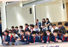
課堂體驗：音樂課「京劇」