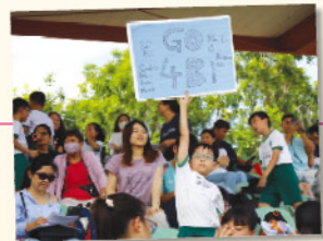
看台上的「啦啦隊」高舉着自製的打氣牌，為運動員吶喊加油。