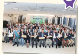
眾志成城，社會各界同為減碳、環保出一分力。

此外，本校十多位同學亦成為「碳中和小先鋒」，積極向全校師生宣傳減碳行動，號召師生加入「青年減碳平台」，實踐減碳行動。