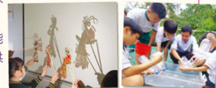
學生學習皮影戲的表演形式，加深對我國非物質文化遺產的認識。