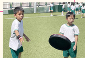
「躲避盤挑戰賽」看看誰的反應快。