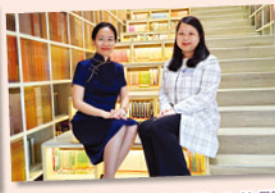
以「書籍是人類進步的階梯」理念設計的圖書館。