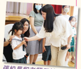
張校長和老師們鼓勵學生們努力學習，發揮自己的潛能，珍惜師長的教導，激勵他們成為更好的自己。