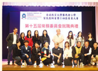
第十四屆及第十五屆家長教師會委員一同合照。

第十四屆家長教師會會員大會順利舉行，會上通過了會務報告及財務報告，並進行第十五屆家長教師會委員的就職儀式。家長教師會對各家長的支持致以萬二分感謝，並承諾竭盡所能，與學校攜手，共同建設美好和諧校園，共同扶助學生成長。