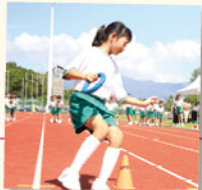
小小健兒身手敏捷，鬥志昂揚，令人欣賞。

本校成功復辦了疫情後的第一個學校運動會，同學們終於能夠脫下口罩，自由呼吸運動場上的空氣，感受自由奔馳的快樂。在兩天的比賽中，同學們盡情展現自己的運動潛能，全力投入每一個賽事，他們奮力衝刺、跳躍、投擲，每一個動作都展現了他們的努力和鬥志。同時，看台上的同學們也熱情地為運動健兒加油打氣，提供無窮的動力和支持。是次運動會為同學創造了難忘的回憶，同時為整個學校注入了活力和凝聚力。