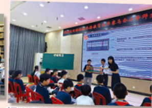
課堂體驗：非遺課「中國珠算」。