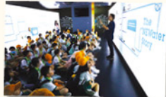
參觀新生水廠期間，學生認識到如何通過綠色創新技術有效地處理和回收污水，實現可持續的用水管理。