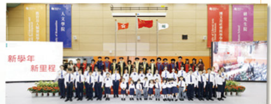
參加教大開學日升旗禮，開啟「新學年 新里程」。