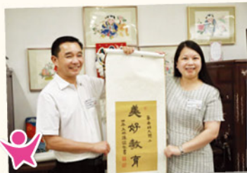
張校長向嘉賓介紹中華文化室、非遗花牌，讓嘉賓了解本校在推動中華文化教育方面的工作。