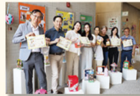
家教會的代表為老師們獻上果籃和中秋月餅，表達了對老師們無私奉獻的感激之意，並送上最真摯的祝福。