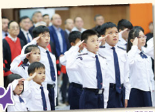
本校升旗隊員英姿煥發，參與隆重的教大開學升旗禮。

本校300多位小四至小六學生及教師首次參與香港教育大學舉辦的「新學年 新里程」開學日升旗禮。當天的升旗隊成員由教大學生、賽小同學和香港教育大學幼兒發展中心的小朋友組成，展現了三代同堂、薪火相傳的意念。教大新任校長李子建教授在開學禮講話中，寄望教育工作者能培養學生成為一個貢獻社會、立足國家、面向世界的優秀公民。