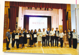
兩校互贈紀念品，彰顯友誼。