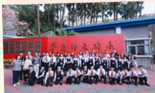
華師附小熱情迎接教大貴小師生的到來。

是次行程中最精彩的環節，就是到姊妹學校華南師範大學附屬小學（天河區）交流。本校師生除參觀華師大附小的校舍外，更獲特別安排參與不同科目的課堂體驗活動。