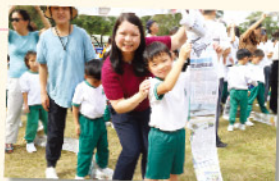
張校長與低小學生一同參與旅行日親子遊戲，大家樂也融融。

學校旅行是每年一度的盛大活動。低小學生及高小學生分別到烏溪沙青年新村及香港浸會園旅行。低小組親子旅行為家長與家長，及家長與教師之間提供更多接觸和交流的機會；高小組旅行讓學生親近大自然，舒展身心。這也為師生間提供更多互動、增進情誼的好機會。