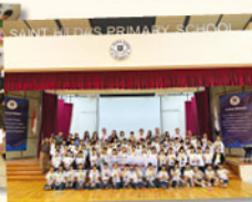
本次遊學中為濃墨重彩的是與當地學校 St. Hilda's Primary School 的學生進行交流，透過多元化的方式分享各自學校的特色和學習經驗，以及彼此的學習心得和生活文化。