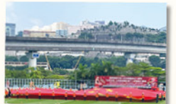
舉行升旗禮時，大會展示了一面巨大的國旗，現場有千人一同高唱國歌，場面極為壯觀。