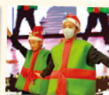
聖誕學藝匯演上，學生打扮成聖誕禮物，展開一場跳舞派對。