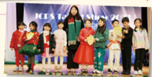
張校長為學藝匯演的優勝同學頒獎。

是次聯歡會是疫情後第一次全體師生共同參與的慶祝活動，台上台下打成一片，氣氛熱烈，大家盡興而歸，渡過了難忘的一天。