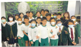
同學們在迦密柏雨中學大門前留影。

12月8日，本校小六學生獲恩主教書院邀請，參加該校舉辦的「中學課堂體驗活動2023」，學生不僅能親身體驗中學課堂的學習模式，還參觀了書展和聆聽賀妙珍校長對該校特色的介紹，進一步了解該校的辦學理念和學習環境。