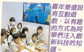
嘉年華還設有互動遊戲，以有趣的方式為同學們注入創新科技的知識。