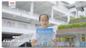
本校學生能參與宣傳片拍攝，實感榮幸。

中央人民廣播電台「港好普通話」節目為廣受歡迎的文化節目，節目中的「經典共讀」環節讓學生朗讀經典文學作品，展現學生對文學作品的理解和詮釋，並培養大眾對文學藝術的興趣。本學年，本校推薦普通話口語能力達相當水平的同學參與該節目錄製，學生以普通話錄製閱讀中國文言經典作品讀後感，當中的優秀錄音作品已獲選於節目中播出，本校師生更獲邀參與該節目宣傳片拍攝。