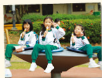
好友們一起玩樂，享受愉快的旅行時光。