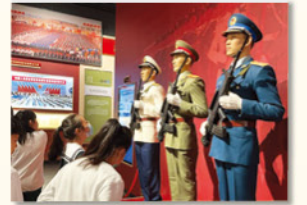
「強軍夢」展廳介紹了中國軍隊的歷史和發展。