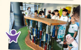
學生跟隨導師透過觀察及思考，認識香港「轉廢為能」的環保發展概況。