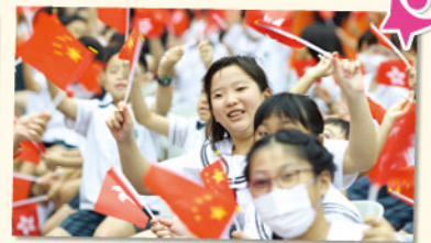
同學們揮舞著手中的國旗和區旗，現場彷彿湧現一片紅色的海洋。