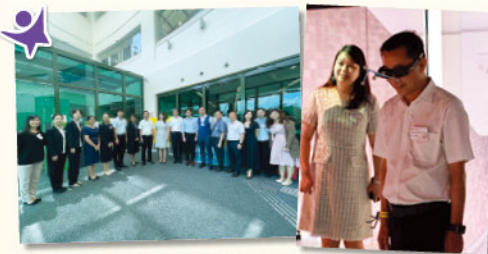
一眾嘉賓到教大參觀圖書館內的「未來教室」，體驗本校學生亦使用的室內創新教學工具和教學模式。