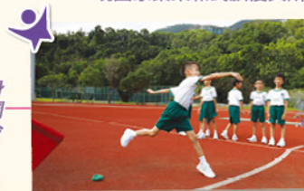
同學年紀雖小，但一擲千鈞，力量驚人。