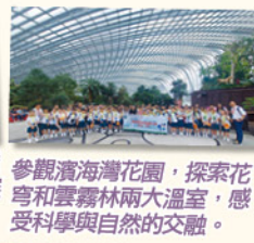
參觀濱海灣花園，探索花穹和雲霧林兩大溫室，感受科學與自然的交融。