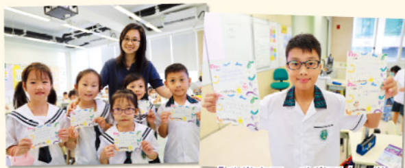
全校師生參與，互贈「我欣賞你」讚美卡。

本校一年一度的「教大賽小讚美日」於10月下旬舉行，是次活動旨在啟迪學生的正向思維，培養尊重和感恩的價值觀。活動不僅提升了學生的自尊和自信，還促進了師生之間的互動和合作。透過尊重和鼓勵，建立一個充滿共融和友善的校園氛圍，讓每位師生都能感受到被重視和接納的溫暖。