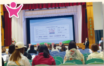
科主任為小一家長介紹課程重點及評估模式。

茶敘當天，各科任老師亦向家長講解輔助子女學習的方法，並介紹學校評估模式，以便家長、學生更好地準備首次評估。相信是次茶聚能有效地協助小一新生及家長更好地為新階段的學習生活作準備。