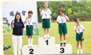
張校長為一眾運動健將頒發獎牌。