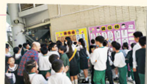
誠信榜公佈能夠做到承諾守信的學生名單，學生們紛紛聚集榜前觀看。