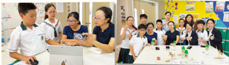
同學也參與了交流活動，他們在窗戶課室向嘉賓分享各個學科和領域的學習成果，獲得嘉賓的讚賞和鼓勵。