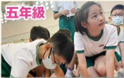
「合力創作口號和海報」為己為人打氣、加油！

本校於學期初，假保良局北潭涌渡假營分別為小四及小五學生舉辦了三日兩夜的成長訓練營。這是疫情後首次復辦的宿營活動，本校為學生安排了一系列有趣且具有挑戰性的活動，如小四的夜行挑戰、智多星活動和躲避盤挑戰賽等，小五的歷奇活動和新興運動等。是次訓練營不僅培養了學生互相尊重及團隊合作的精神，更培養了他們的溝通能力、解難能力，加深了對班級的歸屬感，增進彼此間的友誼，實在獲益良多。