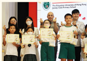
學生代表們向老師致送感謝狀，並獻上中秋節禮物，彰顯了學生們對老師辛勤教導的感激之情。

本校舉辦了「敬師日」活動，以加強學生「尊師重道」的意識。當天，除了有學生親自撰寫敬師卡贈予老師以表達對老師辛勞教導的誠摯謝意外，家長亦參與其中，為老師送上親手製作應節的食品向老師致意。張校長及一眾老師則鼓勵學生繼續用功學習，發揮潛能，珍惜師長的教導，並激勵學生力爭上游，成為更好的自己。「敬師日」活動可凝聚師生情誼，共同傳承敬師的美德，更促進了學校、學生和家長之間的聯繫和合作，共建充滿愛和感恩的和諧校園。