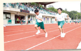
同學們全力爭勝，拼勁十足。