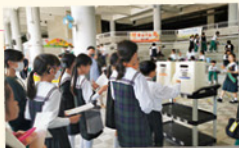
學生積極參與活動，逐一把「誠信支票」投進箱內，「誠信日」活動正式拉開序幕。

「誠信」是教育局推行價值觀教育中十二種首要的價值觀和態度之一，也是一種基本的品格，對學生個人成長有著重要意義。為讓學生認識及實踐「誠信」這一重要品格，本校舉辦「一諾千金 誠信無價」活動，透過活動傳達「重信守諾」的訊息。本校於12月19日下午更為學生預備了「師生同樂」節目，獎勵積極參與活動，表現出色的學生與老師一同遊戲或進行師生友誼賽。是次活動強化了學生的誠信意識，實際體驗到誠信所帶來的正面影響，並從中學習如何在日常生活中展現誠實和正直的品格。