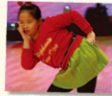
同學身穿色彩繽紛的服飾活力表演，充滿節日氣氛。