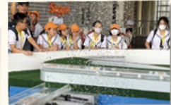
濱海堤壩通過海水淡化技術將海水轉為可飲用水，讓學生了解新加坡如何應對供水短缺的挑戰。