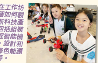
同學在工作坊中學習如何製作創新科技產品，包括組裝和編程智能機器人，設計和製作綠色能源產品等。