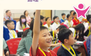
師生們參觀了新加坡國立大學，了解當地頂尖學府的學習環境，並參與一系列精彩的人工智能課程。