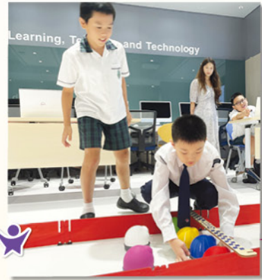
學生製作的 AlphaAI Learning Robot 準備在賽道上大顯身手。