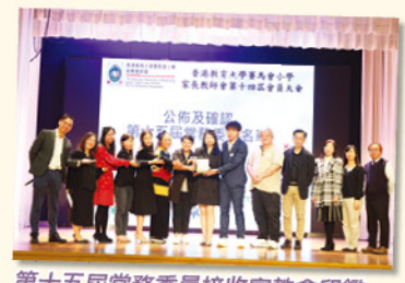
第十五屆常務委員接收家教會印鑑。