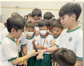
破冰遊戲讓現場氣氛熱鬧起來。