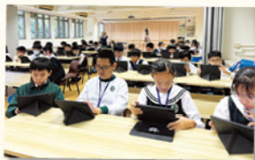
課堂體驗活動，學生實地了解恩主教書院的學習環境。