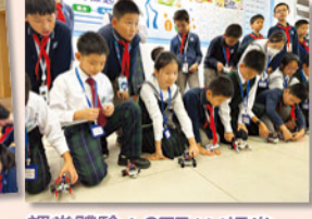
課堂體驗：STEAM課堂，兩校學生共同動手組裝機械車，並加以編程。