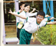
同學勇於挑戰自我，從冒險中找到樂趣。