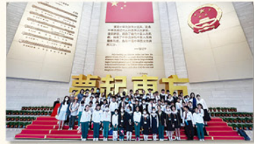
在「中國夢」展廳中，學生了解到中國的發展道路和目標，以及中國人民為實現國家繁榮和民族復興所做出的努力。

為讓學生認識駐香港部隊的工作及中國軍事設備的先進發展，本校安排五年級學生參觀駐香港部隊展覽中心，透過參觀駐香港部隊展覽中心「中國夢、強軍夢、香江衛士」三個展廳及解放軍裝備模型，學生加深了對國家法治和國情的認識，並增進對國家軍事歷史的了解，提升國民身份認同。