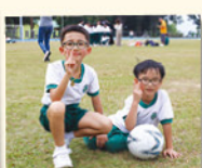
兩位未來球王在草地上盡情揮灑汗水。