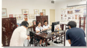
同學參與專業拍攝工作的經驗不多，但拍攝時毫不怯場，表現自信。