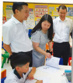
本校特別安排了PLP-R/W英文觀摩課堂，讓華師附小的嘉賓們深入了解本校的英文教學模式。