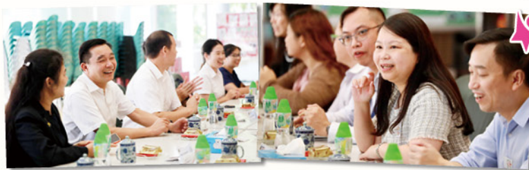
在領導團隊層面，兩校的校長和副校長進行了深入的交流和討論，分享了各自學校的辦學經驗和成果。

2023年9月26日，姊妹學校華南師範大學附屬小學（天河區）的八位領導嘉賓首次到訪本校交流。是次交流活動涵蓋了領導團隊、教師和學生等多個層面，既包括了正式的會議和觀摩課堂活動，也有輕鬆的聚餐和校園參觀，讓嘉賓們全面了解本校的教育環境和學校文化，同時亦有效促進了兩校教師的專業成長，加深兩校之間的友誼。