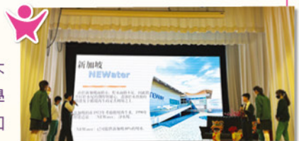
跨學科學習範疇的研習課，高年級向低年級同學介紹有關新加坡如何善用水资源。

「跨學科學習」範疇的研習課則以聯合國「可持續發展目標（SDGs）」為學習主題，為學生提供實地考察機會，著重培養學生探究精神及思維能力，啟迪學生融會貫通已有知識，學會於現實生活中善用所學，藉以鞏固學科知識，及達致學以致用的果效。