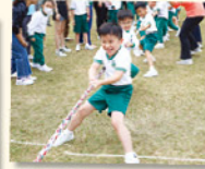
低小旅行的親子拔河比賽，令同學既緊張，又興奮，在加油聲中拼盡全力爭勝。