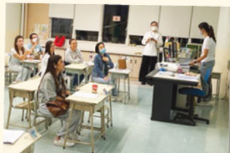
班主任與小一家長交流互動，冀能共同協助學生茁壯成長。