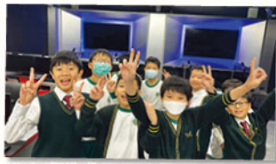
小六學生參觀迦密柏雨中學的課室，充滿新鮮感。