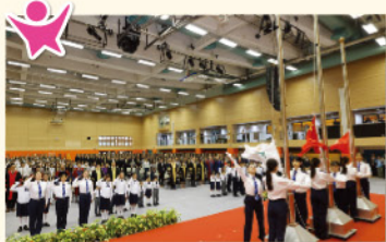
升旗儀式，盛大莊嚴。