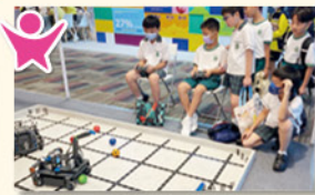
同學們積極投入攤位活動中，並與專業人士進行交流和討論，體驗創新科技的樂趣。

為推廣社區內的創科文化，香港特別行政區創新科技署主辦的「創新科技嘉年華 2023」，本校安排小三和小五學生參與是次活動，透過參觀本地研發成果展，參加攤位活動、工作坊和互動遊戲感受「香港製造」的科技成就及創意潮流，藉此提升學生的解難能力、創新思維和實踐能力，並響應綠色科技和社區建設的重要議題，激發他們對科技創新和可持續發展的興趣和熱情。