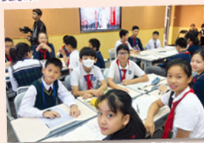
課堂體驗：中文課《走進魯迅·我的伯父魯迅先生》