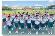
現場有數千名學生聚集在廣闊的運動場草地上，展示武藝操。

這個具有重要意義的盛大活動吸引了全港50多所中小學參與，展示學生的武藝和團隊合作精神，同時亦提升了學生對國粹的認識，促進文化自信。