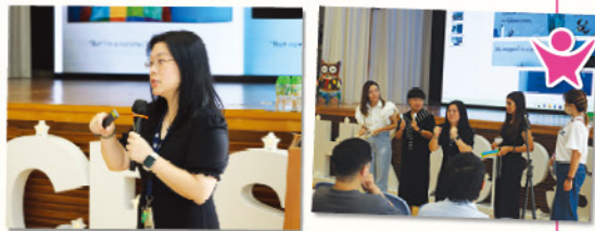
陳女士藉現場活動，讓家長體驗與孩子共同閱讀的樂趣。